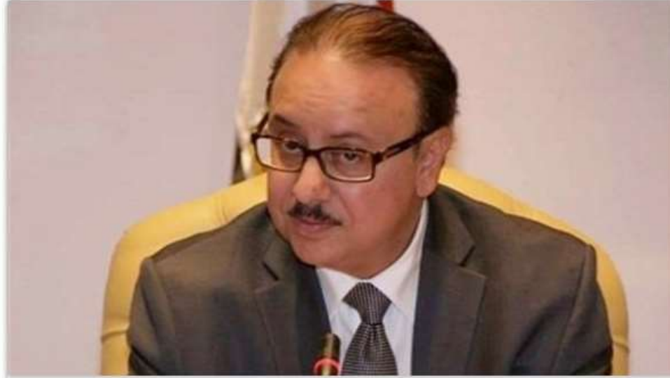
المهندس ياسر القاضي وزير الاتصالات