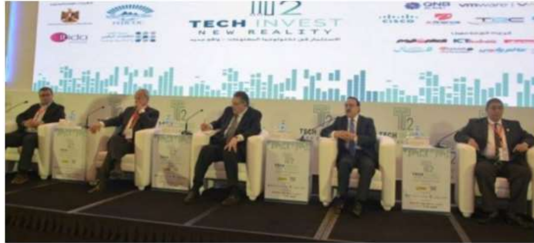
الملتقى السنوي الخامس للشعبة العامة للاقتصاد الرقمي والتكنولوجيا