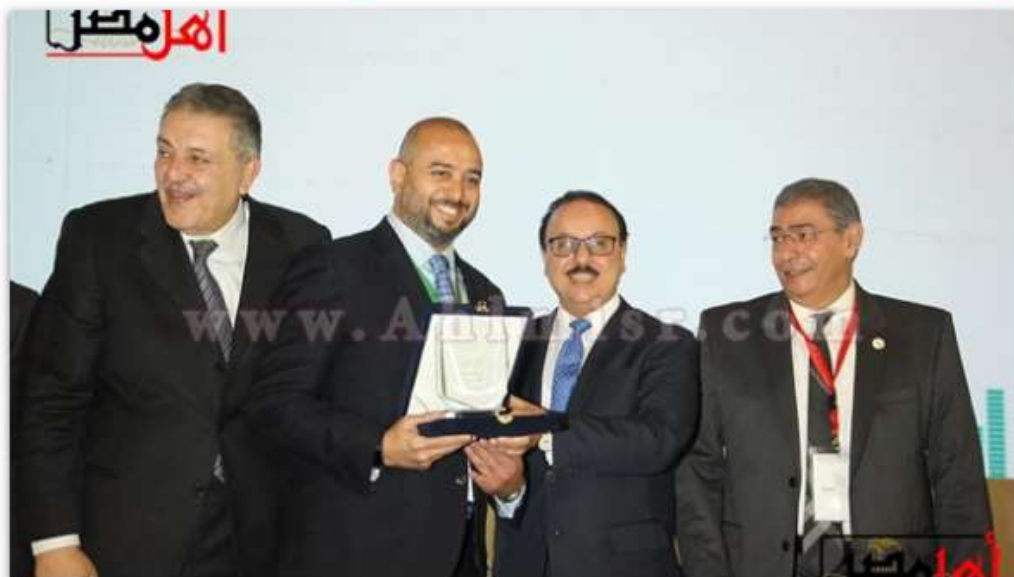
الملتقى السنوي الخامس للاقتصاد الرقمي