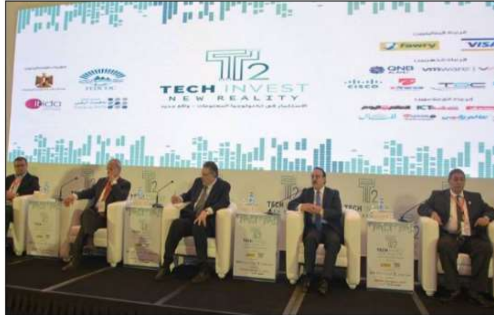
ختام أعمال المؤتمر السنوي الخامس لشعبة الاقتصاد الرقمي والتكنولوجيا