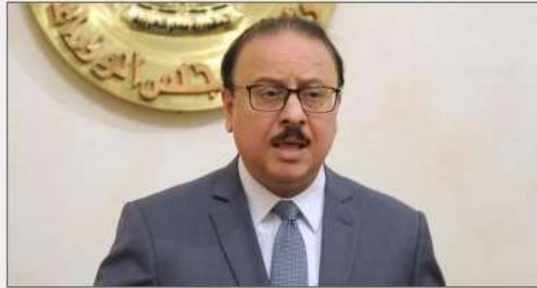
المهندس ياسر القاضي وزير الاتصالات