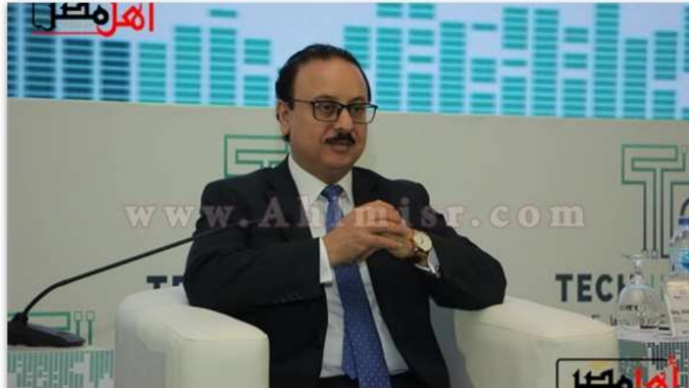
ياسر القاضي وزير الاتصالات