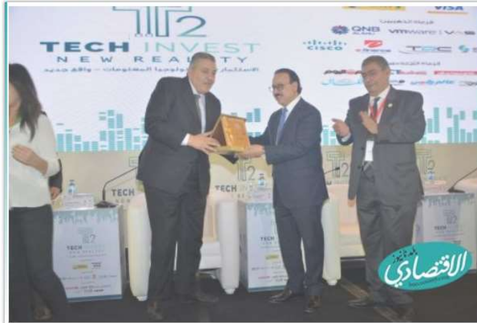
ختام الملتقى السنوي الخامس للشعبة العامة للاقتصاد الرقمي