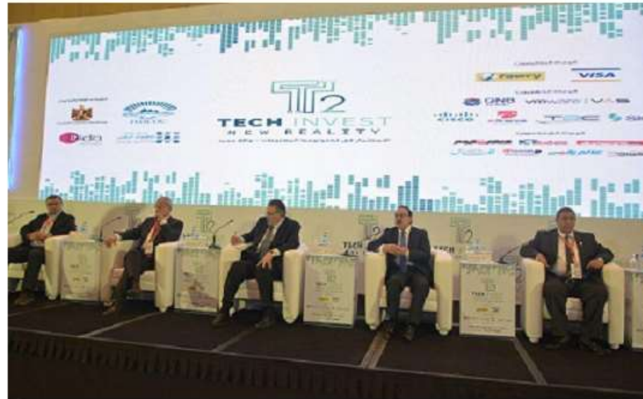
20 توصية في ختام الملتقى السنوي الخامس للشعبة العامة للاقتصاد الرقمي والتكنولوجيا